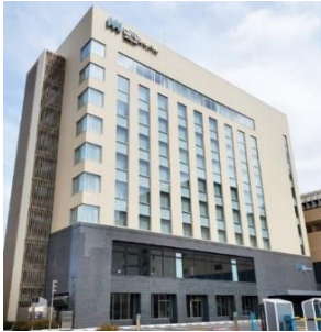
【別館 (NORTH WING)】